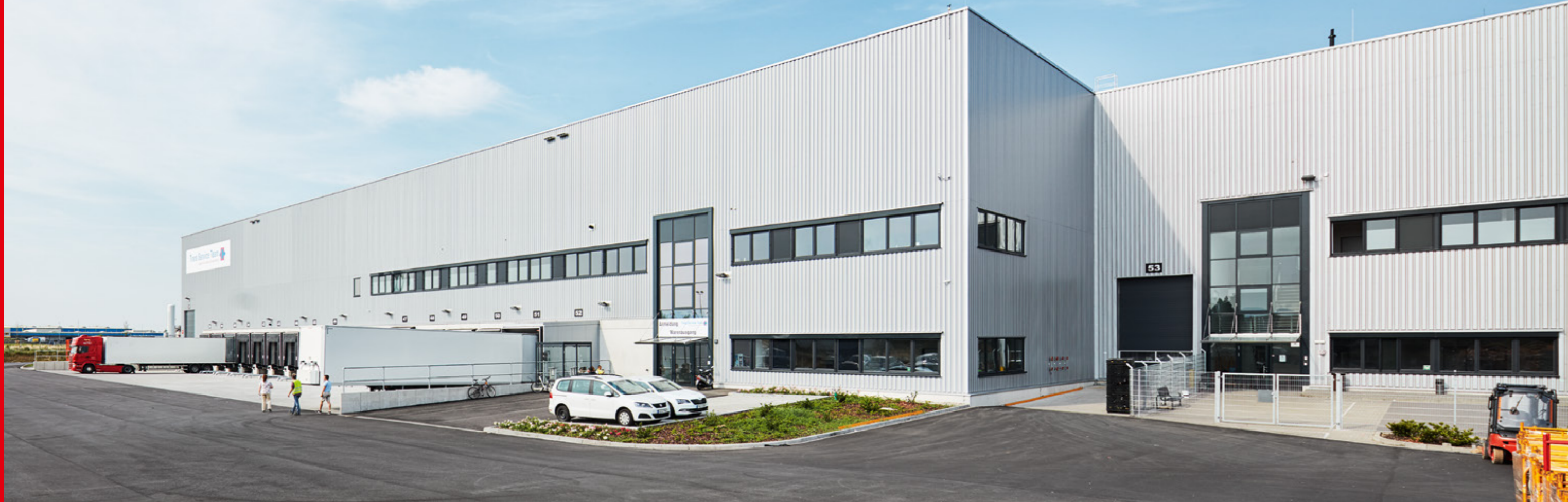
TST Logistikzentrum, Biebesheim