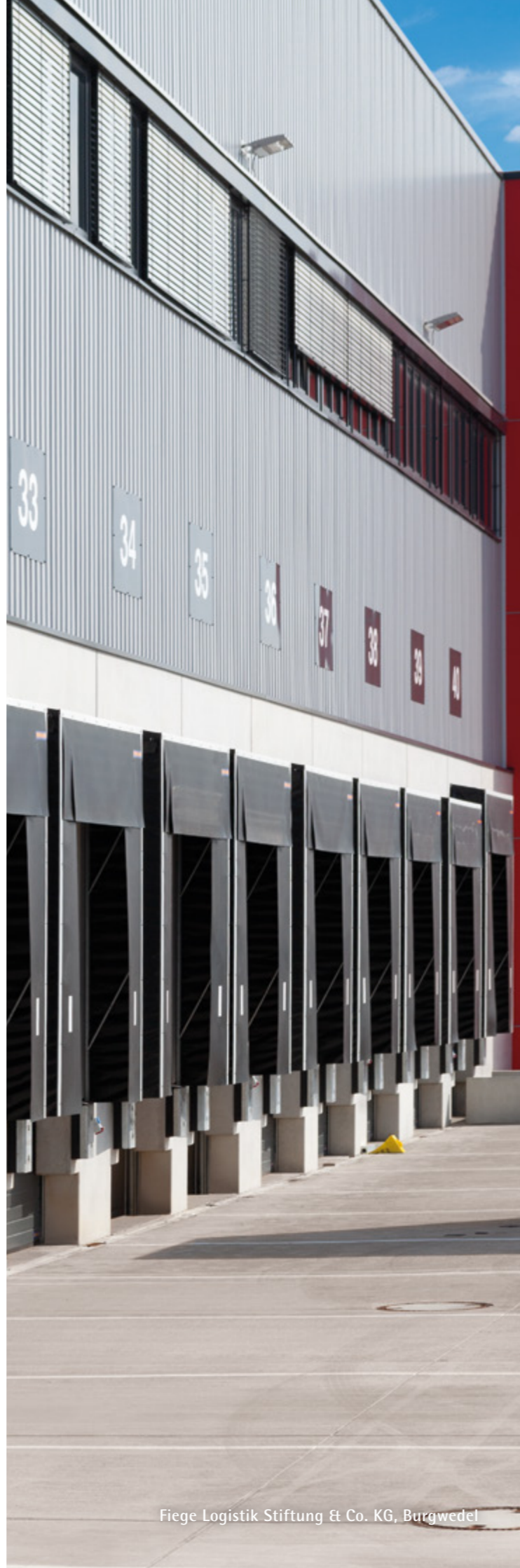
Fiege Logistik Stiftung & Co. KG, Burgwedel