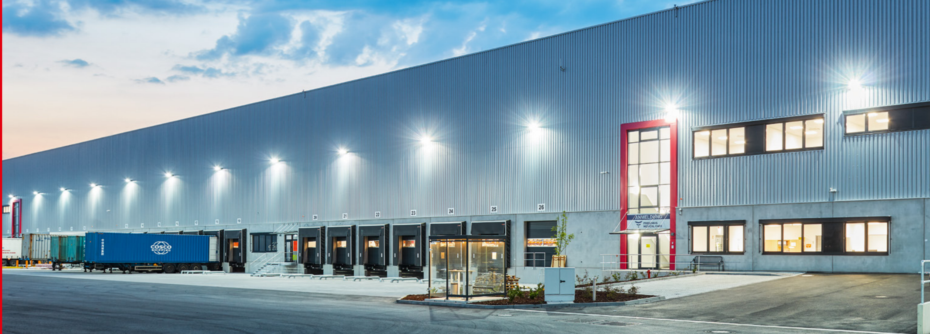
TST Logistikzentrum, Gernsheim